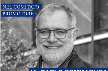
Me CARLO SOMMARUGA

BROUILLON Politicien suisse membre du Parti socialiste. Avocat de formation, il a été membre du Conseil national de 2003 à 2019 et siège depuis 2019 au Conseil des États pour le Canton de Genève. Il s'est distingué par son engagement en faveur des Droits Humains, de la justice sociale, des loyers et de la politique étrangère. Il est également président de l'Association suisse des locataires. Il allie expérience politique et sensibilité aux questions humanitaires.