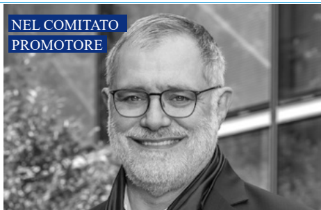
Avv CARLO SOMMARUGA

BOZZA Politico svizzero del Partito Socialista. Avvocato di formazione, è stato membro del Consiglio Nazionale dal 2003 al 2019 e dal 2019 fa parte del Consiglio degli Stati per il Canton Ginevra. Si è distinto per il suo impegno su Diritti Umani, giustizia sociale, affitti e politica estera. È anche attivo come presidente dell'Associazione Svizzera Inquilini. Unisce esperienza politica e sensibilità per temi umanitari.